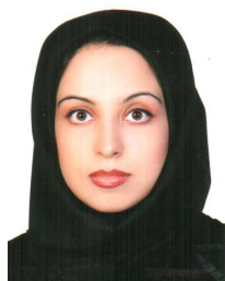
ماه نسائی اعظم

شماره نظام مهندسی: 3109101799 کارشناسی، زراعت و اصلاح نباتات استان محل فعالیت: البرز شهرستان محل فعالیت: کرج رتبه: پنج، پیمانکاران